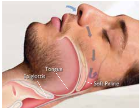
Opstruktivna apneja tokom spavanja